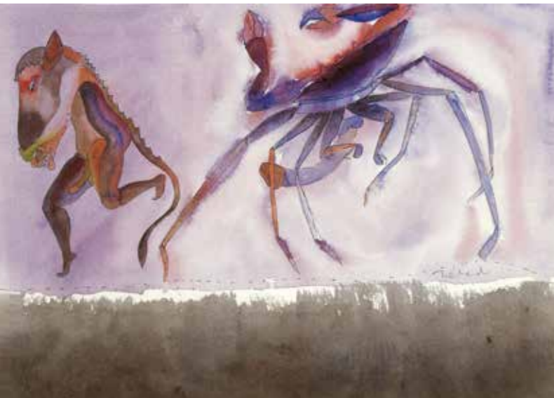
Francisco Toledo Un rey de fuego y su caballo Een koning uit vuur en zijn paard (1983) Uit Zoología Fantástica Inkt en aquarel op papier 23,5 x 32,5 cm Verzameling Würth, inv.nr. 16309_42

In 2016 herdenkt 's-Hertogenbosch dat Jheronimus Bosch 500 jaar geleden overleed. Het Jheronimus Boschjaar is voor Kunstlocatie Würth en Rabobank de aanleiding tot het maken van een gezamenlijke tentoonstelling met werken uit hun kunstcollecties, die raakvlakken hebben met de thema's van Bosch. Daarvoor werden uit beide bedrijfscollecties werken van kunstenaars geselecteerd met een heel eigen beeldtaal, die zich ook in het huidige tijdsgewricht laten inspireren door de werkelijke en waanzinnige aspecten van het leven.