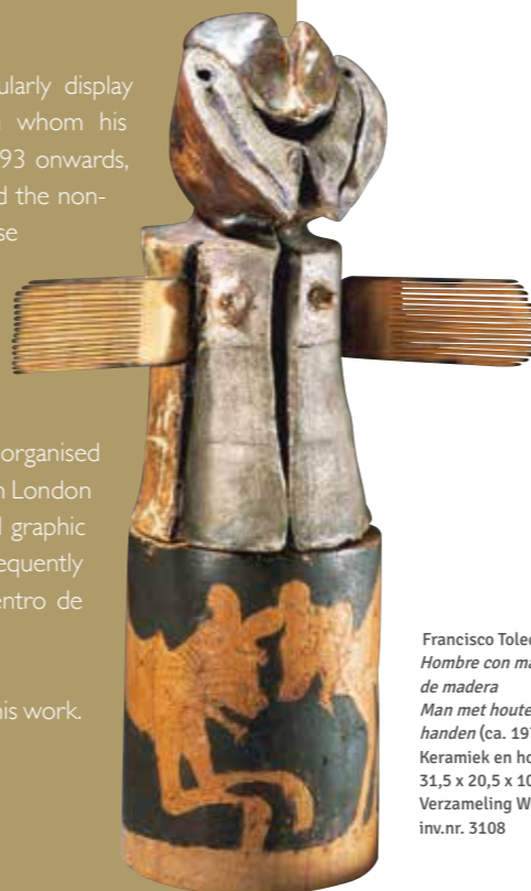
Francisco Toledo Hombre con manos de madera Man met houten handen (ca. 1970) Keramiek en hout 31,5 x 20,5 x 10 cm Verzameling Würth, inv.nr. 3108

Toledo has received various awards for his work.