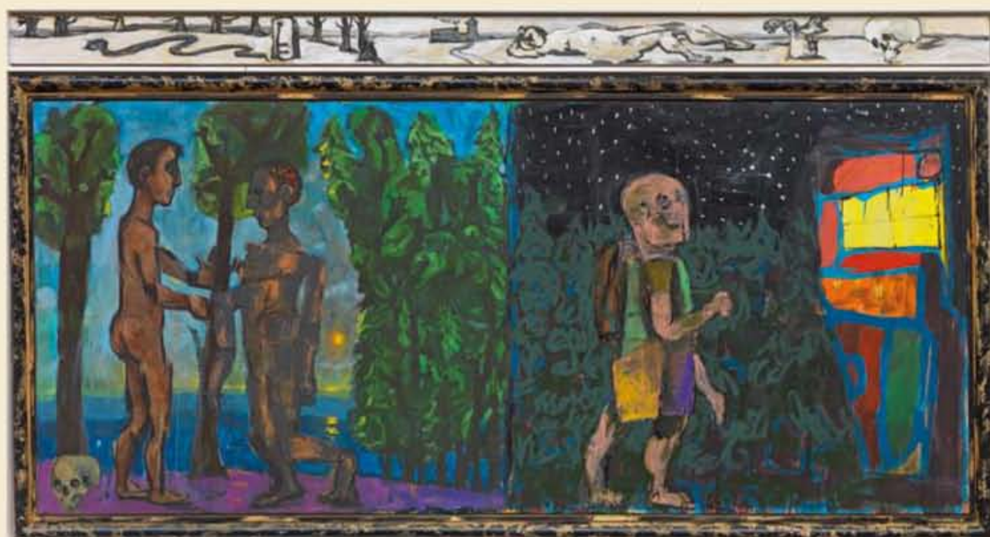
Markus Lüpertz, Morgen/Mittag/Abend/Nacht of Abschied/Überfall/Heiliger Samariter/Ankunft an der Herberge , 2009, olieverf op linnen en olieverf op hout (4-delig). l: 146 x 243 cm, ll: 146 x 146 cm, ill: 133 x 301 cm + 20 x 301 cm, Verzameling Würth, inv. 12616