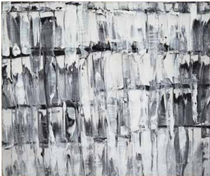
Raimund Girke Grauhell (1959) Gemengde techniek op neteldoek 100 x 120 cm [Verzameling Würth, inv. 4640]

'Schilder van het licht', zoals Raimund Girke ook wordt genoemd, werd geboren in 1930 in Heinzendorf (Neder-Silezië) en overleed in Keulen in 2002 na een leven dat gewijd was aan het schilderen. De kunstwerken van Girke kenmerken zich niet door een bont kleurenpalet, maar onderscheiden zich door tinten wit. Een handschrift dat vanaf de jaren vijftig steeds duidelijker wordt en een belangrijke bijdrage aan de naoorlogse schilderkunst in Duitsland levert.