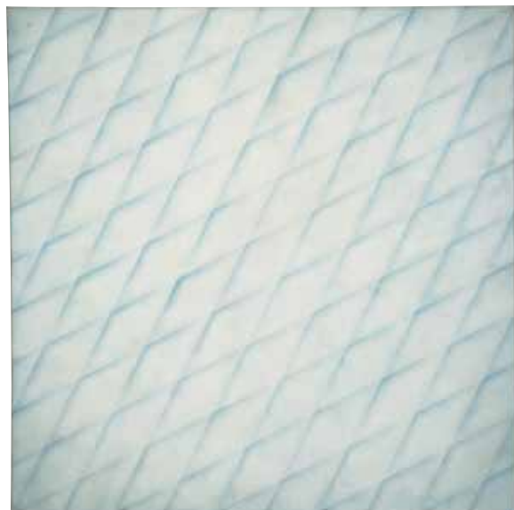
Raimund Girke Diagonal- struktur (1968) Kunsthars op canvas 110 x 110 cm [Verzameling Würth, inv. 4641]

Raimund Girke, the 'painter of light', was born in Heinsdorf (Lower Silesia) in 1930 and died in Cologne (Germany) in 2002 after a lifetime devoted to painting. Girke's works are not characterized by a colourful palette, but are distinguished by shades of white. With his signature style, that started to become ever more distinct in the 1950s, he made an important contribution to post-war painting in Germany.