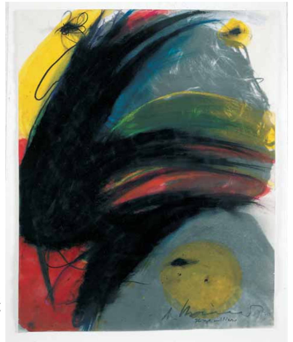
Arnulf Rainer, Face Farce (Fliege und Nase)/Face Farce (Fly and nose) , 1969/1970, 52,5 x 42 cm, verzameling Würth, inv. 1631

wel inspirerend. Rainer zoekt in 1951 in Parijs contacten met de internationale, surrealistische groep. De ontmoetingen zijn niet succesvol maar een tentoonstelling getiteld 'l'Art informel', met o.a. Wols,