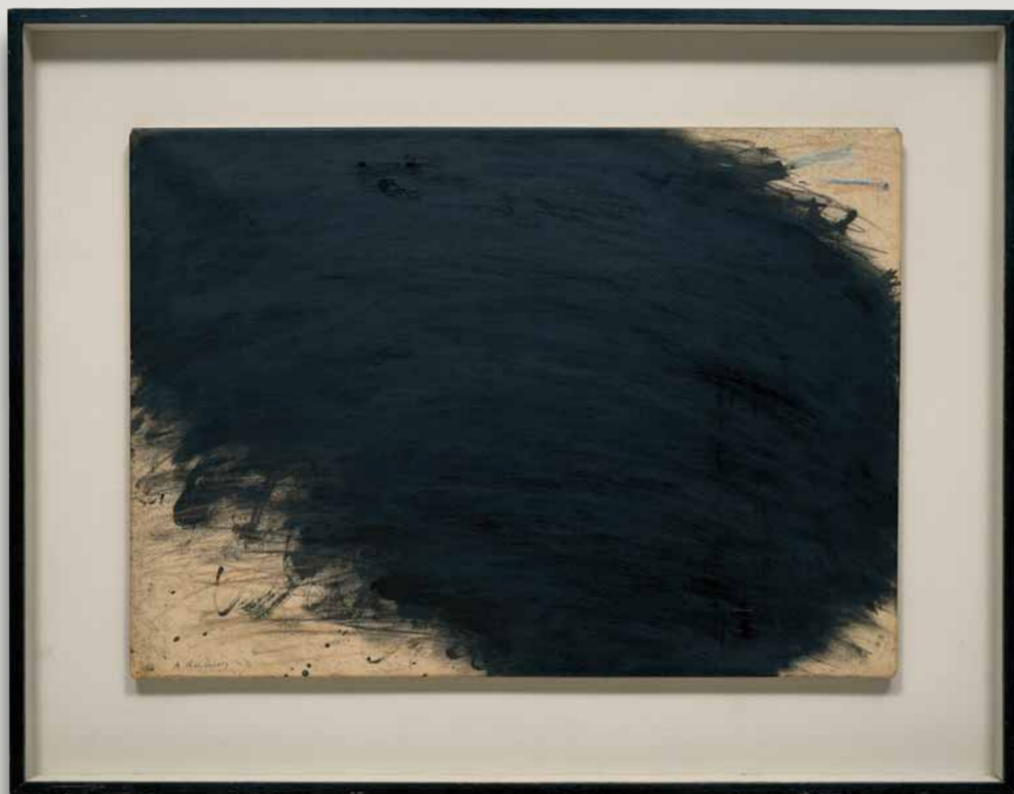
Arnulf Rainer, Grosse Übermalung/Large Overpainting, 1955/1961, 50 x 70 cm, verzamelung Würth, inv. 2638