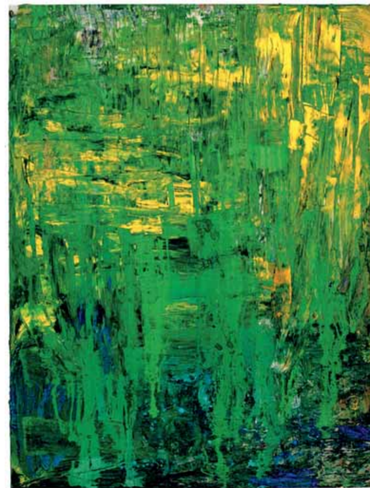
Nikolaus Moser, Zonder titel , 2006, 170 x 130 cm, verzameling Würth, inv. 9382

Naast de Übermalungen is er een tweede intensief toegepaste methode, het beschilderen van foto's. Foto's van hemzelf, zelfportretten, of foto's van anderen en vaak ook foto's van kunstwerken. In het midden van de jaren '60 nemen de fotowerken de plaats in van de schilderijen. Grote series beschilderde of betekende foto's laten studies zien van houdingen en handelingen van het menselijke lichaam. Rainer lijkt op zoek te zijn naar nog niet eerder geziene lichamelijke uitdrukkingen en emoties. De eindeloze series met Körperstudien zijn natuurlijk ook een reactie op de eeuwenlang beoefende anatomiestudies van de traditionele kunstakademies. Deze Körpersprache -werken gaan vooraf aan wat jongere kunstenaars later gaan onderzoeken in performances en in body-art. Vanaf 1973 ontstaan er weer meer schilderijen, zelfs grote series waarbij de verf rechtstreeks en zeer beweeglijk met de hand op het vlak wordt aangebracht. In de 'kruisschilderijen' die hierna gemaakt worden, vanaf de jaren '80, zijn vaak een synthese te zien