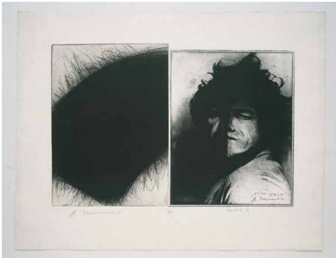
Arnulf Rainer en Dieter Roth, Stirnsplatt/Split Forehead , 1973, 55 x 75 cm, verzameling Würth, inv. 2739

die hij korte tijd gebruikt heeft wordt dan ook losgelaten. Maar van de surrealisten geleerde experimenten met automatisch tekenen en of schilderen met de ogen dicht blijft hij beoefenen. Zo ontstaan vanaf 1952 Rainer's eerste overschilderingen,