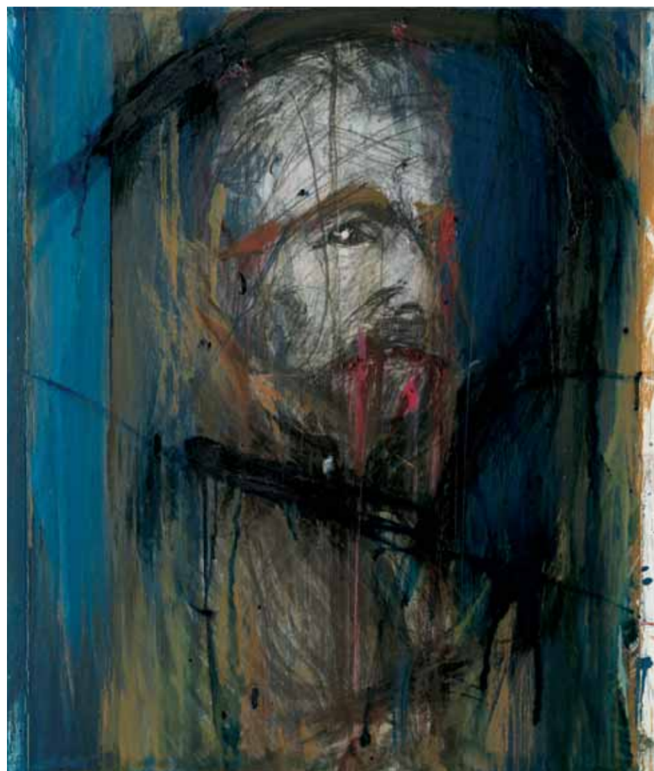
Arnulf Rainer, Van Gogh Übermalung/Van Gogh Overpainting , 1989, 61 x 51 cm, verzameling Würth, inv. 1797