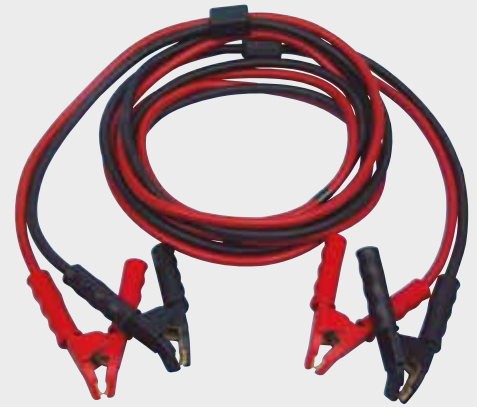
Startkabel 35 mm 2 Art.nr. 0772 035 450