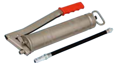
Schaarvetspuit Art.nr. 0986 00