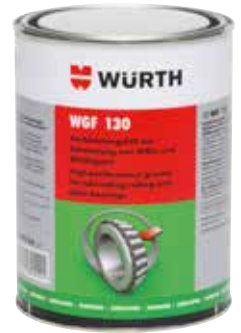
Lager smeervet WGF 130 Art.nr. 0893 530