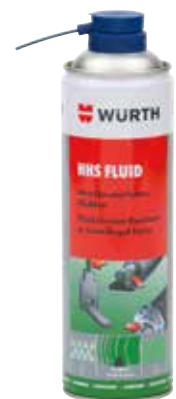
HHS Fluid vloeibaar vet Art.nr. 0893 106 4