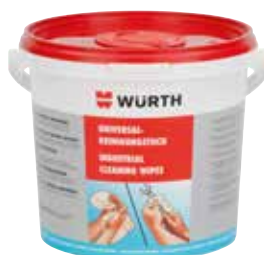
Universele reinigungsdoek Art.nr. 0890 900 90