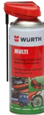
Onderhoudsolie Multi Cobra head Art.nr. 0893 055 400