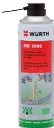
HHS 5000 smeerolie PTFE Art.nr. 0893 106 3