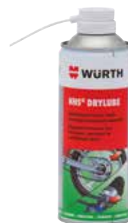
HHS Dry Lube droog smeervet Art.nr. 0893 106 6