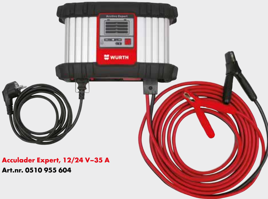
Acculader Expert, 12/24 V-35 A Art.nr. 0510 955 604