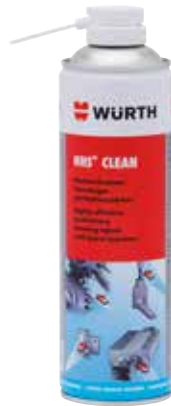
HHS Clean voorreiniger Art.nr. 0893 106 10