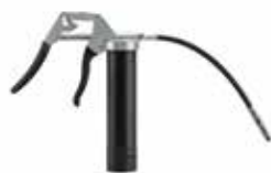
Eénhands vetspuit LS Art.nr. 0986 000 011