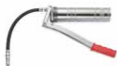
Schaarvetspuit LS Art.nr. 0986 05